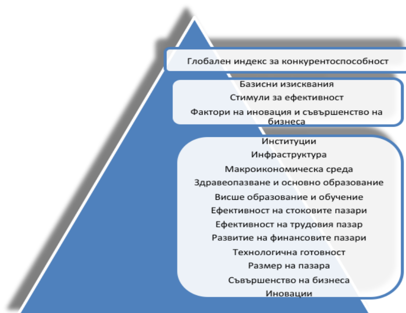
Фигура 1. Пирамида на Глобалния индекс на конкурентоспособността